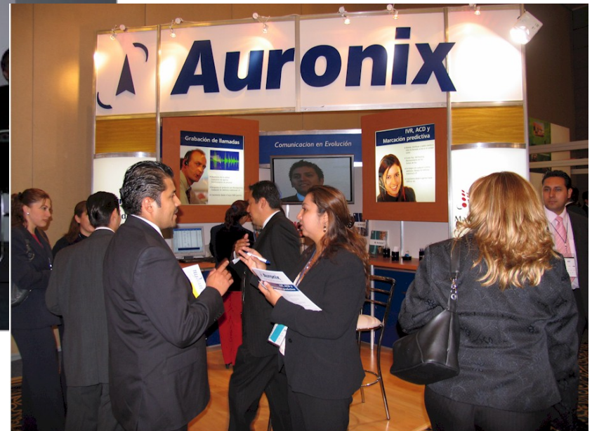
Contact Forum 2006 México y Monterrey