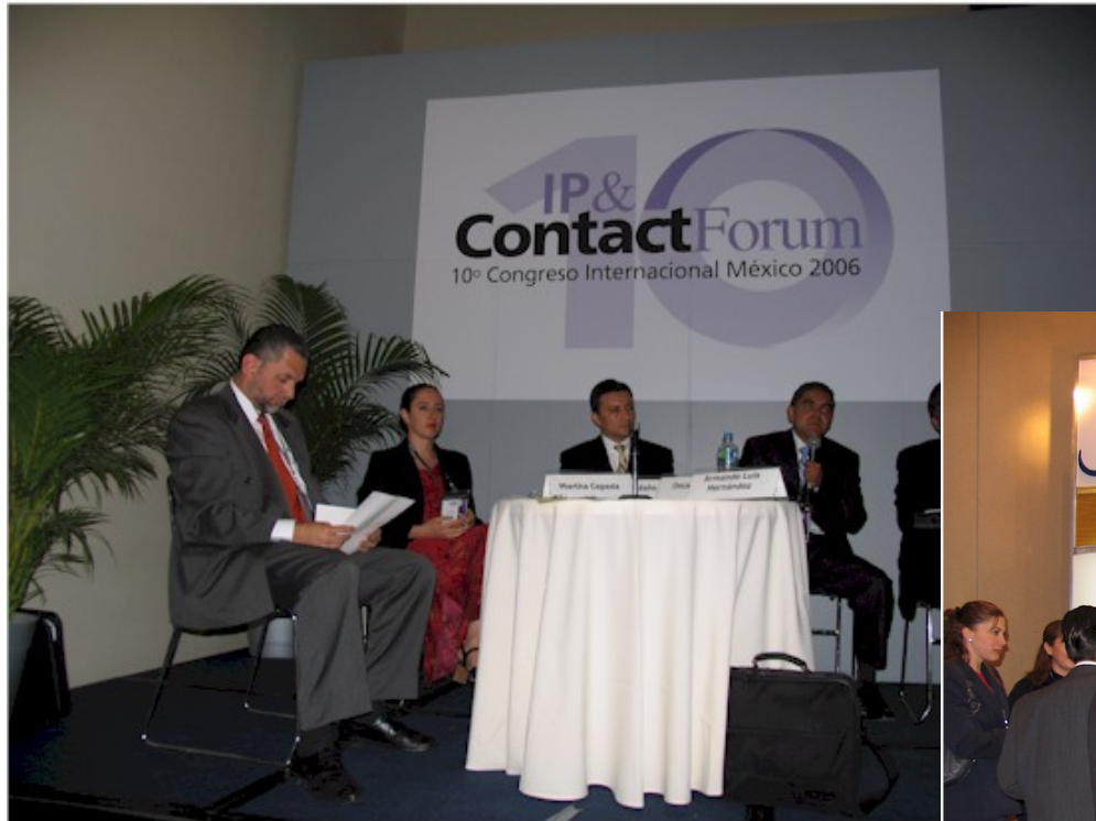
Panel de Tecnologías Emergentes

Auronix es invitado a participar como parte de paneles de opinión en tecnología así como conferencias en eventos de contact-centers